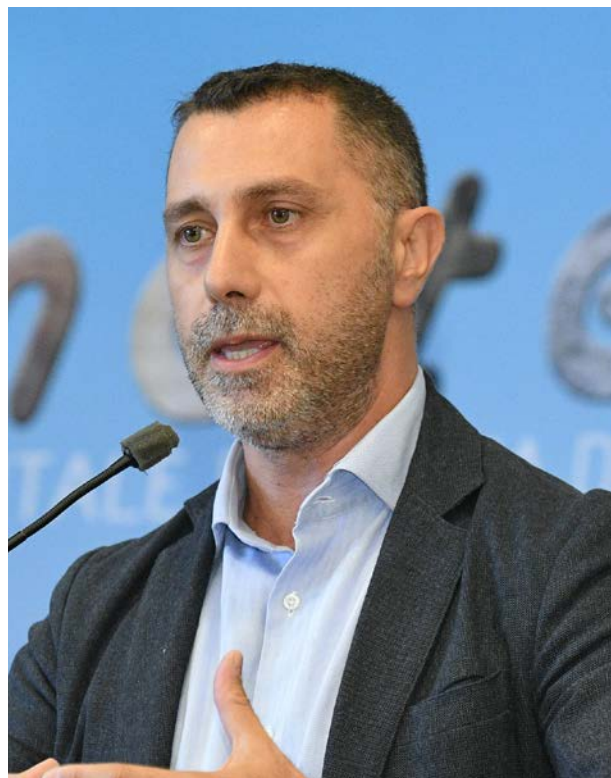
Massimiliano Albanese Segretario Nazionale FAI CISL

Nelle giornate del 30 e del 31 maggio si è svolta a Roma l'assemblea unitaria nazionale di FAI CISL, FLAI CGIL, UILA-UIL, per l'approvazione delle piattaforme di rinnovo dei CCNL dell'Industria e della Cooperazione alimentare. Gli oltre 700 delegati di Fai-Flai-Uila sono stati chiamati a discutere e confrontarsi sui tanti emendamenti, sulle raccomandazioni e sugli ordini del giorno pervenuti dalle migliaia di assemblee che hanno avuto luogo sul territorio italiano, in occasione