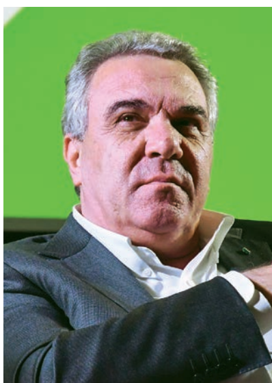
Luigi Sbarra Segretario Generale Cisl

Quello che serve è un nuovo Patto anti inflazione che agisca su due piani: quello del